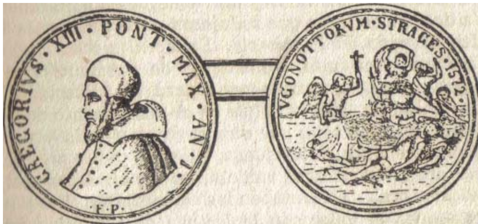
El papa Gregorio XIII.

Esta monstruosa carnicería, perpetrada a favor de una traición infame, arrancó un inmenso grito de horror a toda la cristiandad evangélica. Pero el papa Gregorio XIII triunfaba. Hizo cantar un Te Deum, y para perpetuar el recuerdo de este sangriento auto de fe, hizo acuñar una medalla con la inscripción siguiente